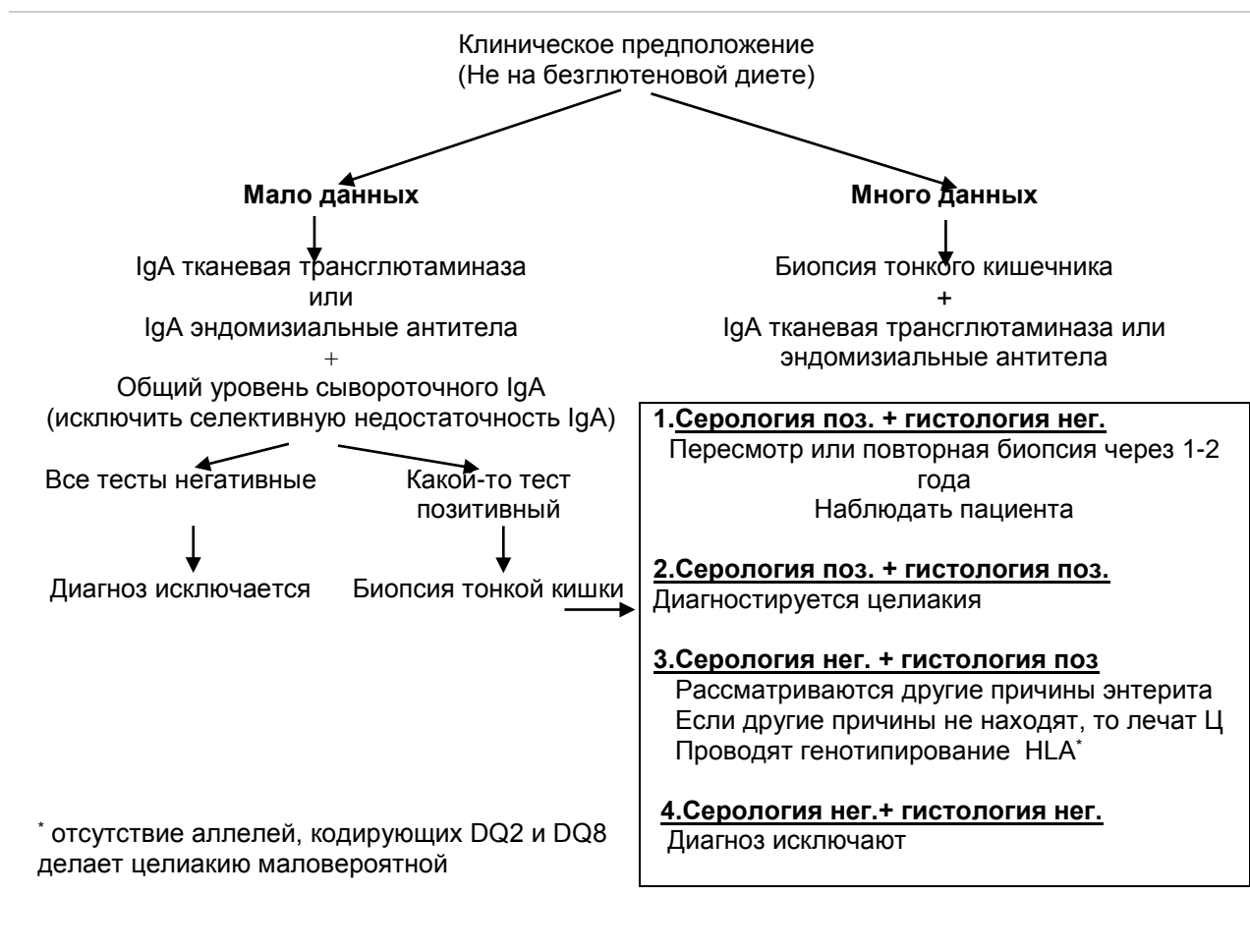
Табл. 3. Диагностика целиакии.

Только эндоскопия с биопсией тонкого кишечника в сочетании с положительной на Ц серологией дают определенный диагноз. Такой подход считается золотым стандартом.